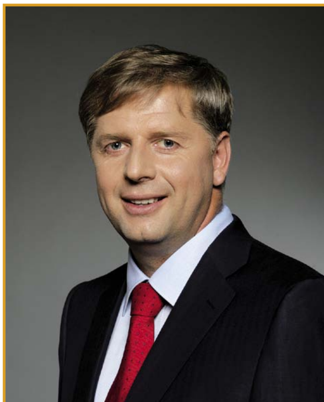
Ing. Petr Bendl ministr zemědělství Minister of Agriculture

I am pleased to be able to introduce the Action Plan of the Czech Republic for the Development of Organic Farming between 2011–2015, submitted to the Government of the Czech Republic for approval at the end of last year. Organic farming and production of organic foods are exemplary fields whose development is driven by all organizations and people interested: the Ministry, non-governmental organizations, food producers and consumers themselves. This was the case in the preparation and implementation of the previous Action Plan and was also the case with this strategic document. For me personally a key point is that it fulfils aims focusing not only on the acreage of organically farmed land but mainly on improving the quality of the whole sector. This especially means the production of good quality Czech organic food. Within this Action Plan we have set an approximate doubling of the number of organic food producers and, above all, the achievement of a 60% share of Czech products on the organic food market. Gradual reduction of dependence on subsidies can also be helped by improved advisory services, education and by providing information. The Ministry of Agriculture utilises a number of instruments for this, e.g. to support investment, organic food sales, education, promotion and research. Organic farming has already become a respected part of the Czech agrarian and food sector. Implementation of this Action Plan will certainly strengthen this situation.