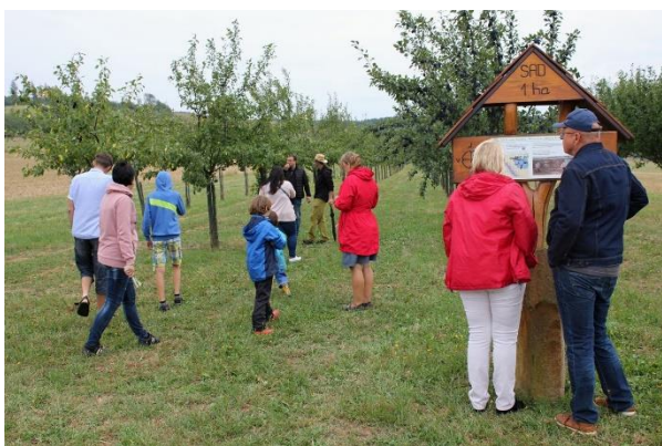
Den otevřených dveří v Ekosadech v Komni

Dny otevřených dveří jsme opět pomáhali uspořádat ekofarmám společně s PRO-BIO RC Bílé Karpaty. Se zajištěním doprovodných programů pomáhaly také další subjekty a organizace, místní spolky i jednotlivci.