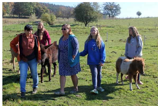
Na farmě Bovine

V roce 2018 jsme díky získané dotaci MZe a podpoře PRO-BIO RC Bílé Karpaty mohli uspořádat třídní exkurzi na ekofarmy do Olomouckého kraje a Jeseníků. Část nákladů si účastníci hradí z vlastních zdrojů.