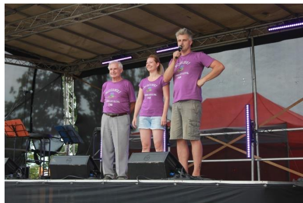
Pořadatelé Levandulového festivalu

Prezentace probíhají většinou na samostatném stánku nebo místě. Účastníci mohou získat informace, materiály a poradenství k ekologickému zemědělství případně i k našemu regionu. Akce jsou pro nás také významné z hlediska prezentace našich činností a získání nových kontaktů.