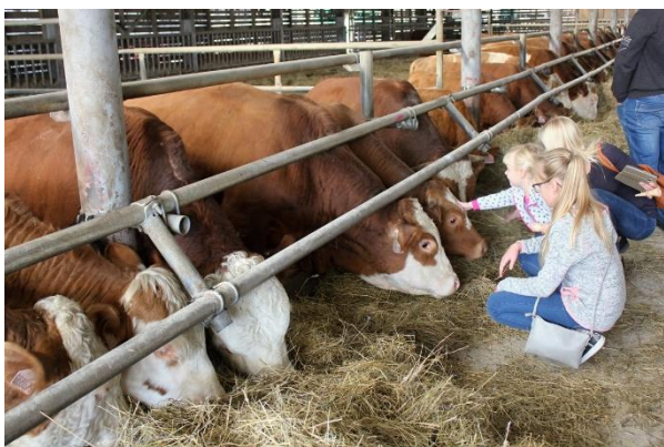
Hospodářský den Agrofyto Lidečko

Dny otevřených dveří jsme opět pomáhali uspořádat ekofarmám společně s PRO-BIO RC Bílé Karpaty. Se zajištěním doprovodných programů pomáhaly také další subjekty a organizace, místní spolky i jednotlivci.