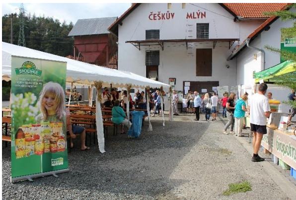
Den otevřených dveří na Češkově mlýně