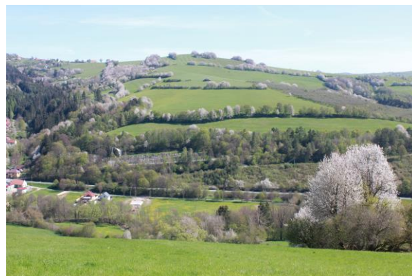
Pohled od Starého Hrozenkova na Žitkovou