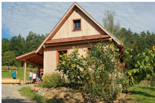
Akce na bylinkové ekofarmě u Fryzelků ve Vlachovicích

Ekozemědělství jsme prezentovali alespoň na několika menších regionálních akcích, které ještě během léta proběhly a které pořadatelé nezrušili: