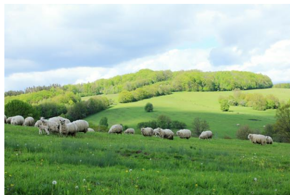
Pastva ovcí ve Vápenicích

V dubnu 2020 proběhla kontrola organizace ze strany Okresní správy sociálního zabezpečení v Uherském Hradišti. Kontrola neshledala žádná pochybení.