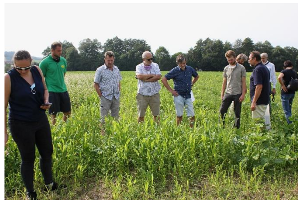
Z polního dne ve Štítné nad Vláří

Tříletý projekt Demonstrační farmy byl v roce 2020 ukončen.